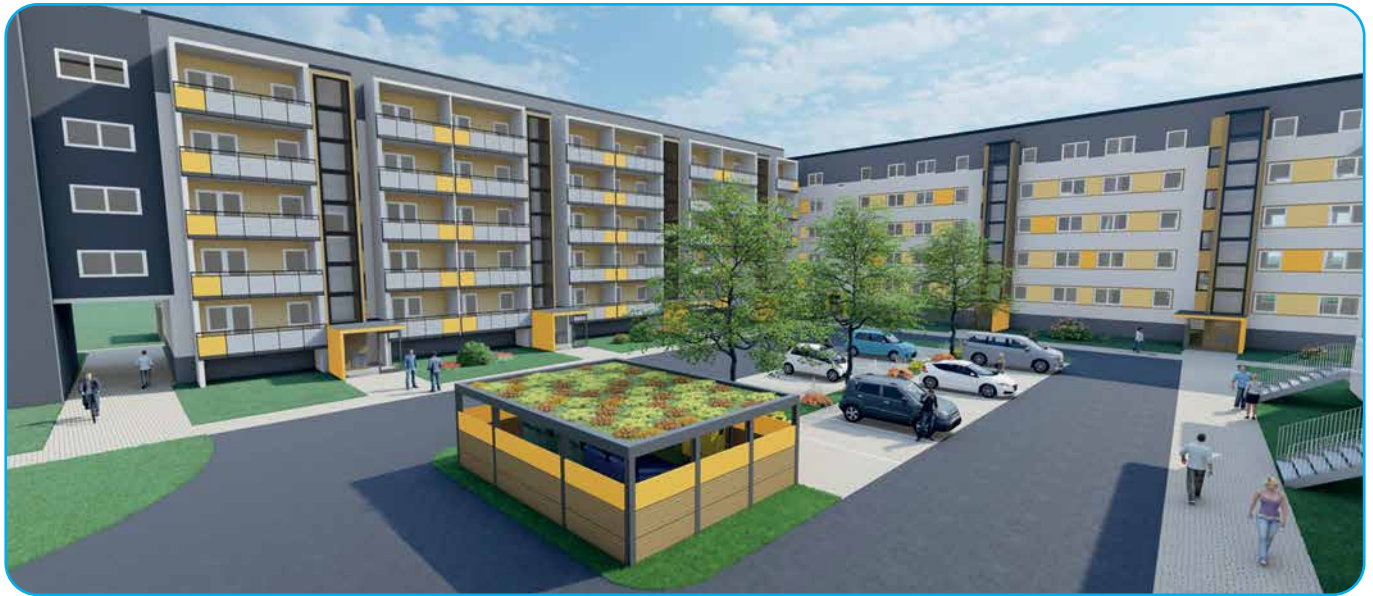
Ausblick Südstraße 45 – 59 nach Fertigstellung

zu den künftigen Balkonen wurden entfernt und neue Balkontür-Fenster-Kombinationen eingebaut. In den kommenden Wochen und Monaten werden die Aufzugstürme und Balkone errichtet, die Fassade neu gedämmt und mit einem neuen Anstrich versehen sowie die Außenanlagen neu gestaltet. Für das Jahr 2022 ist die Fortsetzung der Arbeiten in vergleichbarer Art und Weise am Wohngebäude „Südstraße 45 – 51“ vorgesehen. Die Bautafel weist bereits darauf hin und zeigt, wie es am Ende des kommenden Jahres aussehen soll. Die weiteren Planungen enthalten auch Aufwertungsmaßnahmen in der „Südstraße 17 – 23“, allerdings noch ohne konkreten Termin.