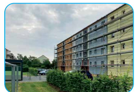
Vorwerkstraße 23a – d