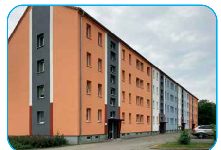
Straße des Aufbaus 2 – 6a

Wir haben uns also viel vorgenommen in diesem Jahr und werden insgesamt rund 4,3 Mio. EUR investieren. Die Finanzierung erfolgt etwa hälftig aus Eigenmitteln der Genossenschaft sowie einem zinsgünstigen Darlehen.