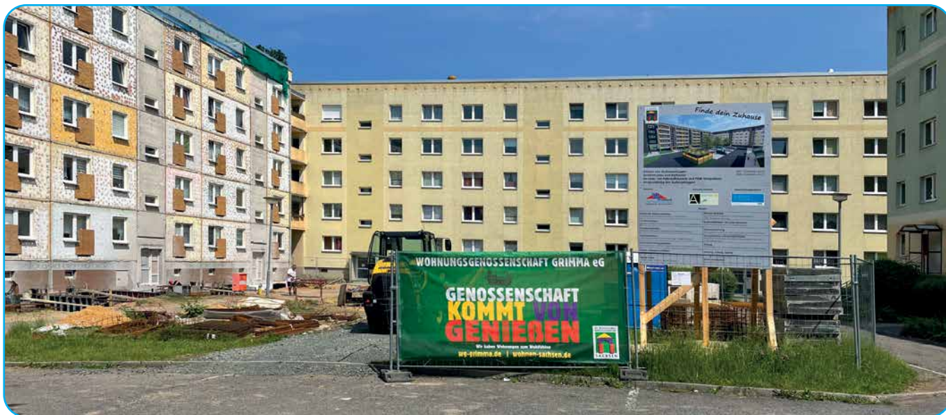
Baubeginn in der Südstraße 45 – 59